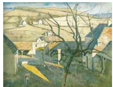
Figure 6 Cour de ferme à Chassy . 1960. Huile sur toile, 130x162 cm. Musée National d'Art Moderne, Centre Georges Pompidou, Paris.

Behalve interieurs en portretten heeft Balthus veel landschappen geschilderd. In Chassy schilderde hij voornamelijk vanuit de ramen van het kasteel, gaande van het ene raam naar het andere, van de ene etage naar de andere. Hij maakte hier veruit de meeste van zijn landschappen. Het was een heel vruchtbare periode, waarin Balthus van de in totaal driehonderd werken,