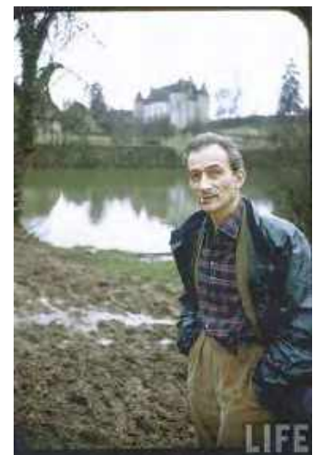
Figure 2 : Balthus devant le Château de Chassy . 1956.