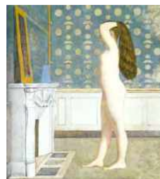
Figure 4 : Nu devant la cheminée. 1955. Huile sur canvas, 190x164 cm. The Metropolitan Museum of Art, New York.