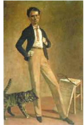
Figure 1 : Le Roi des Chats . Autoportret 1935. Huile sur canvas, 71x48 cm. Collection de l'artiste.

Maar omdat het in dit geval gaat over een tijdelijke bewoner van de Commune van Montreuillon is het zinvol om wat biografische gegevens te verstrekken over deze zo geheimzinnige Comte van het Château de Chassy.